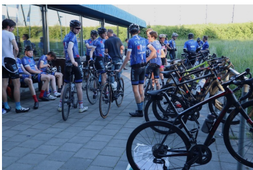
Dat was dan de eerste rit van de Di-Av-Competitie