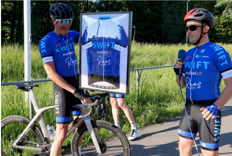
Bij de start van de Raas-Bikes Di-Av-Competitie werd het eerste nieuwe clubshirt aan de nieuwe sponsors aangeboden.