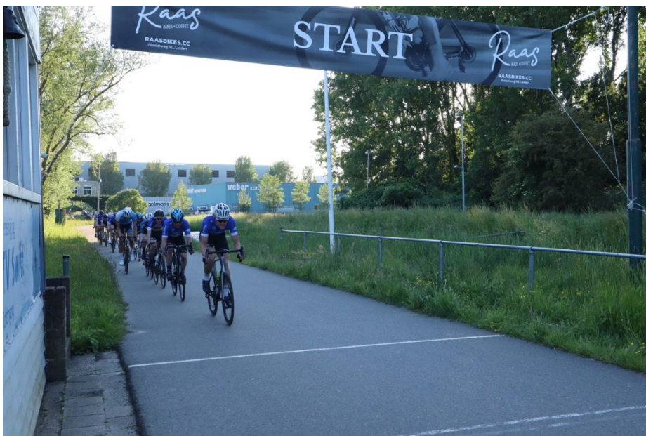
Het seizoen is weer begonnen.