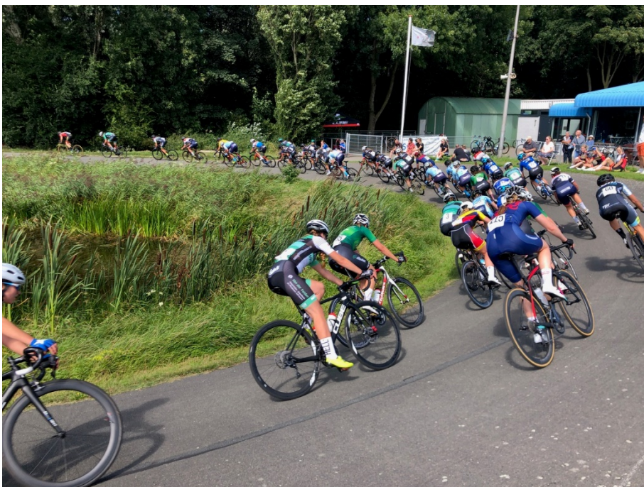
15 augustus. Finale Driedaagse Ladies Cycling

Het parkoers van Swift was op deze zondag het toneel van de laatste etappe van de door de stichting Making the Difference (MtD) georganiseerde driedaagse wedstrijd voor elite- en junior-dames. Ook hier veel rensters aan de start.