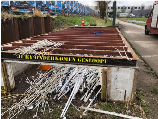
De sloop van het oude en de renners langs het nieuwe jury-onderkomen.