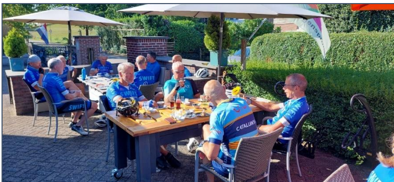
Aan de koffie op het terras tijdens een zomerse Leorit