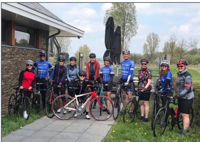
Welkom dames bij Start2Bike!