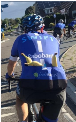
Geen halve maatregelen voor onderweg rond de Markermeer