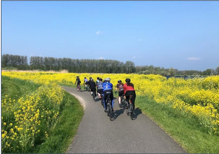
Onderweg met Start2Bike Race tijdens de afsluitende toertocht