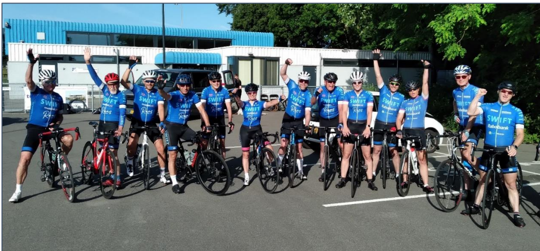
Dit jaar de Speedeazy op zondagmorgen nieuw leven ingeblazen!