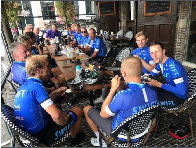
De onvermijdelijke koffiestop tijdens de lange rit om de Markermeer