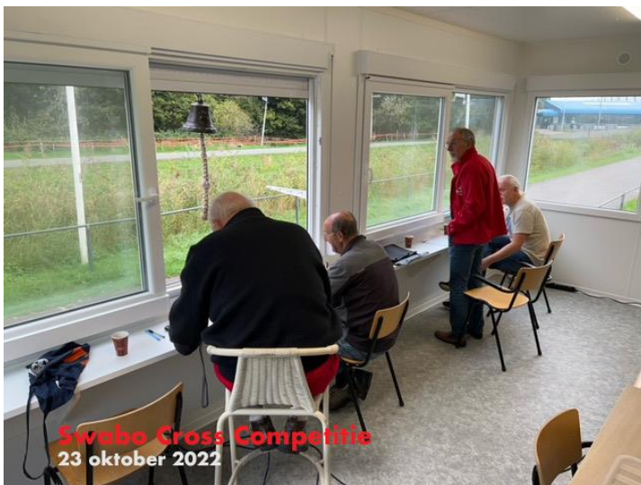
Ons mooie nieuwe jury-onderkomen is het nu goed toeven.

Na het wegseizoen is het weer om te gaan crossen en op zondag 16 oktober is de jaarlijkse Swabo-Cross-Competitie van start gegaan en de finale is op zondag 29 januari 2023. De op ons parcours verreden 2022-crossen waren op 23 oktober, 13 november en 4 december. En mede door het goede weer was de belangstelling zeer goed te noemen; zo'n 40 à 50 deelnemers per wedstrijd en in totaal reden er ca. 90 een of meerdere keren mee.