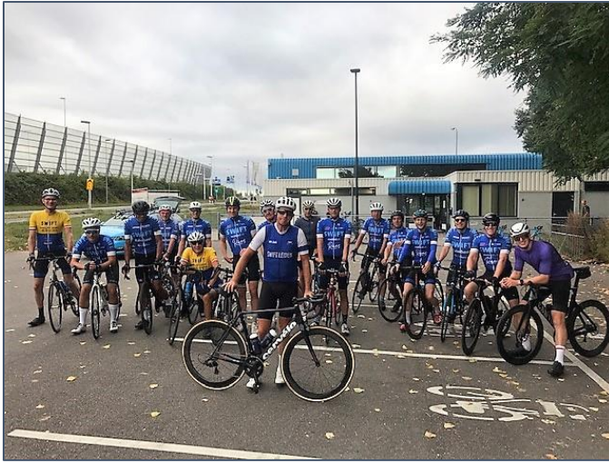
Bij Swift aan de start van het Rondje Markermeer, zaterdag 27 augustus 2022