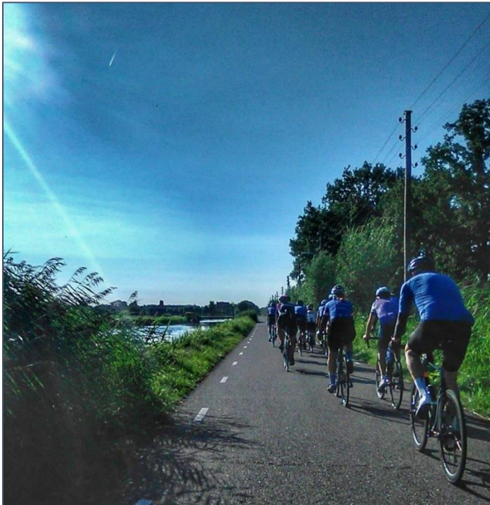
Onderweg met de Leogroep op donderdagochtend