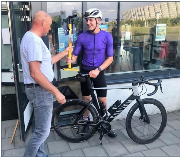
Uitreiking van fietspomp door de voorzitter namens de clubsponsor BBB