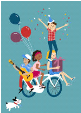
Vanachter de bar.....